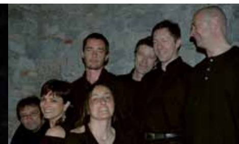
Zuf de Zur